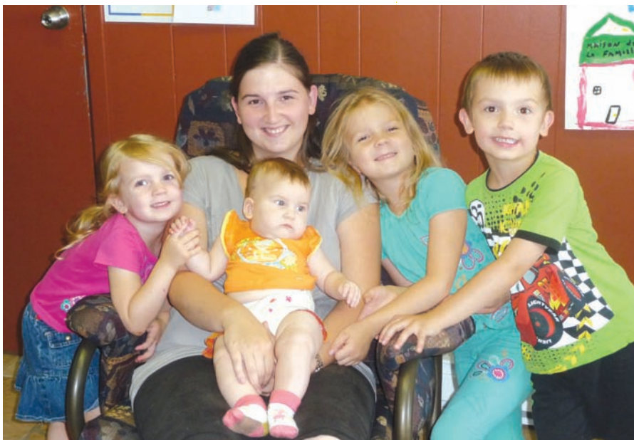
Maison de la Famille de Val-D'or

Plusieurs de ces rencontres ont aussi servi à la réalisation de l' autoportrait qui a d'ailleurs été présenté lors de la Rencontre nationale, en novembre 2012.