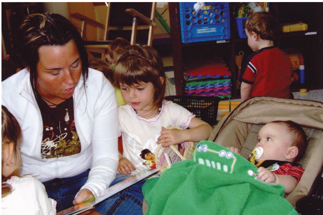
La Maison des Familles de l'Écable