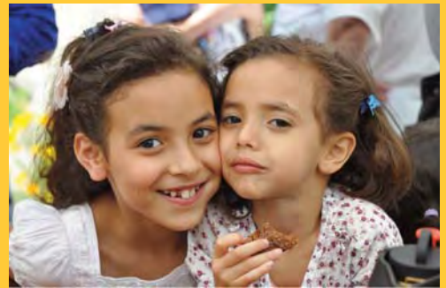
Apprentis d'Auteuil se situe en amont dans la prévention du lien parent-enfant. Accueillir, créer du lien et accompagner sont les trois valeurs fondatrices.

Des communautés de pratiques et de savoirs se sont déroulées en vidéoconférence au cours de la dernière année. Des personnes impliquées dans les maisons des familles en France et dans un organisme au Maroc y ont participé. Dans le prolongement de ce partenariat, une délégation de la Fondation Apprentis d'Auteuil a pris part à la Rencontre nationale 2013 de la FQOCF à Drummondville.