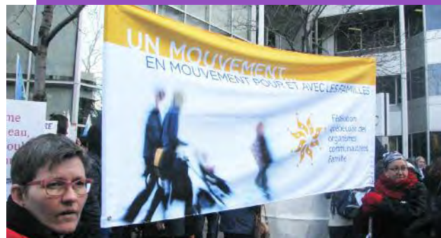
La FQOCF s'est engagée avec d'autres organismes communautaires à manifester lors du grand rassemblement le 23 avril 2014.

— Extrait du communiqué de presse « Mesures d'austérité : Le Québec peut-il se payer le luxe de se passer des organismes communautaires Famille? » publié par la FQOCF, le 31 octobre 2014.