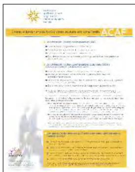
Critères et fondements de l'ACAF